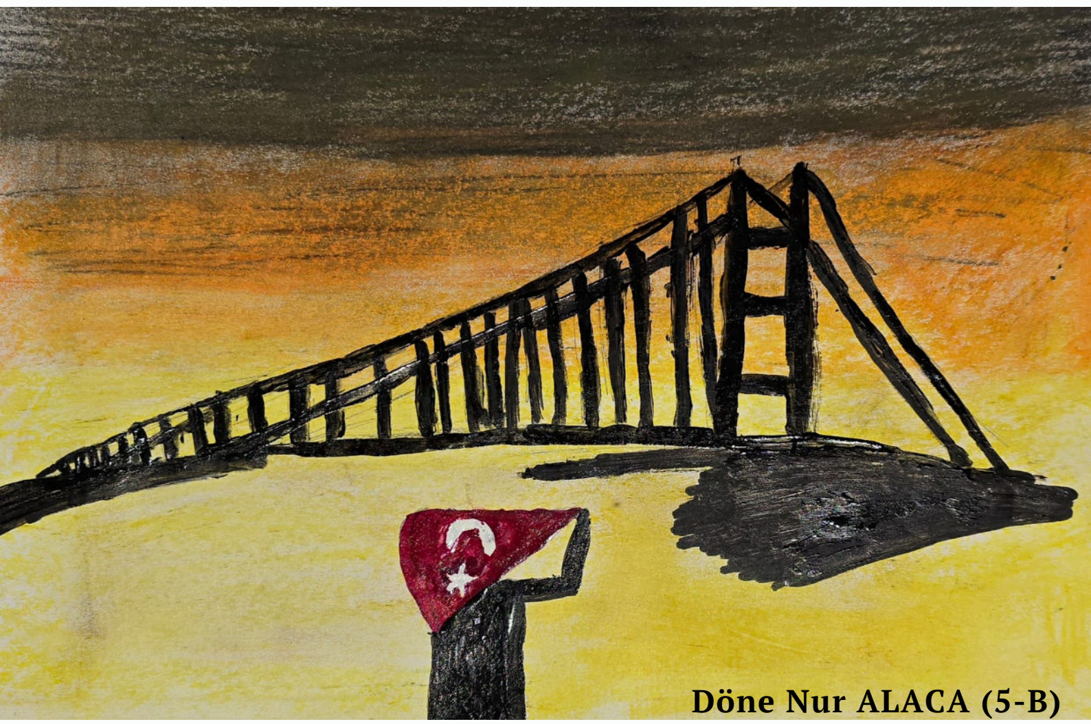
Döne Nur ALACA (5-B)